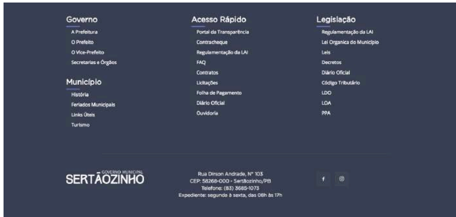
Figura 9 - Rodapé

No rodapé é disponibilizado o mapa do site , com todos os menus, acessos e seus respectivos links. Além disso, no rodapé também é disponibilizado a logomarca do ente, informações de localização, contato e ícones de redes sociais.