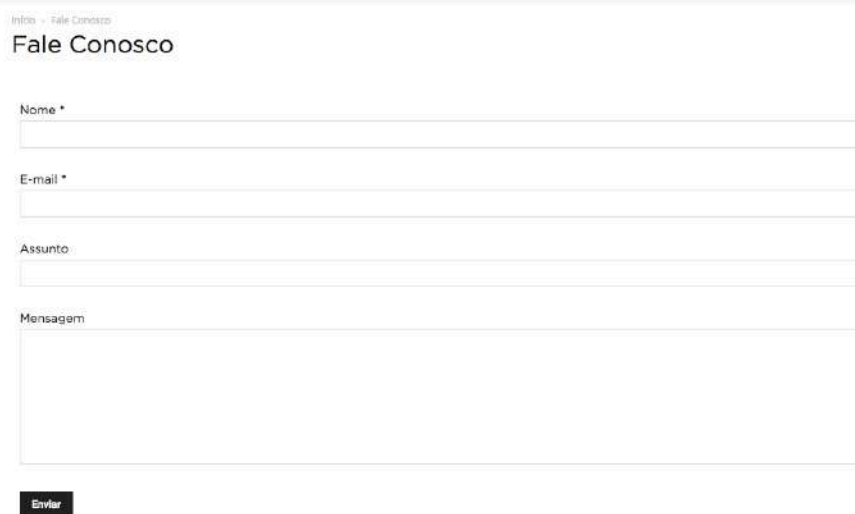
Figura 3 - Fale Conosco

O fale conosco é um formulário de contato que serve como canal de comunicação entre o cidadão e o ente. É importante que o cidadão informe um email e seja claro na sua mensagem para que o ente possa responder de forma eficaz a demanda impetrada.