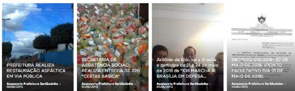
Figura 8 - Galeria de mídias