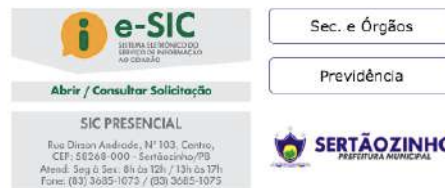
Figura 6 - Acesso rápido