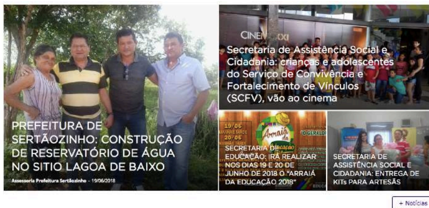
Figura 5 - Módulo de notícias mais recentes

O módulo de notícias é onde ficam disponibilizadas as notícias mais recentes postadas no site. As notícias postadas se referem a atos da gestão do ente ou divulgação de prestação de algum serviço.